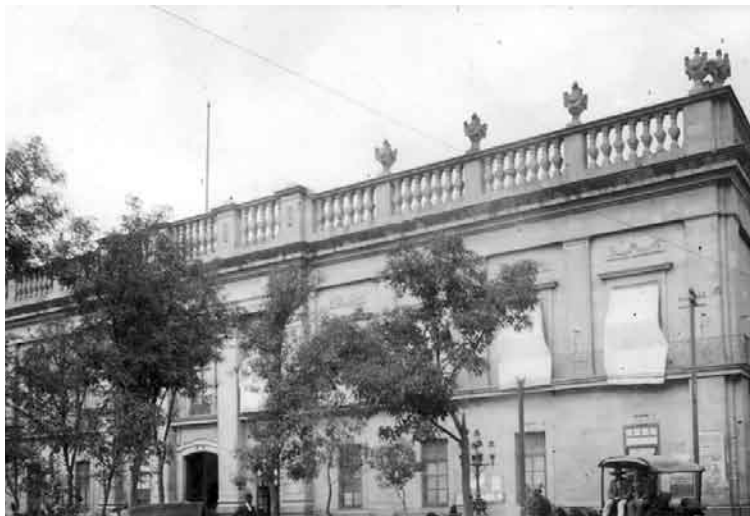
Figura 2. Palacio de gobierno de San Luis Potosí, a finales del siglo XIX. Diseño de Miguel Constanzó