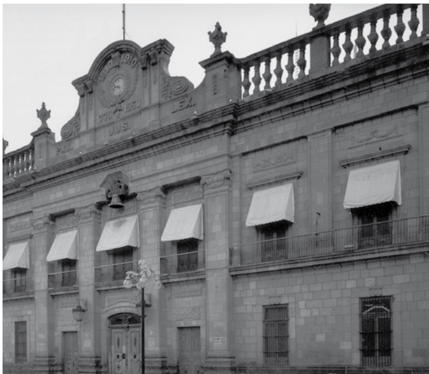
Figura 3. Palacio de gobierno de San Luis Potosí, vista actual