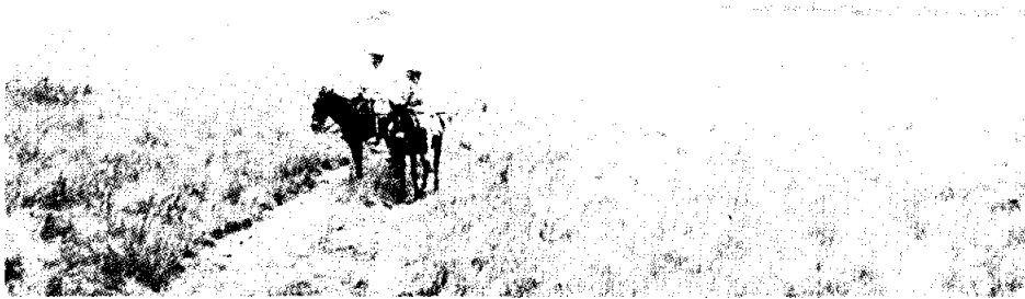
No.1 - Sabanas del Yará. Al fondo un bosque de galería.