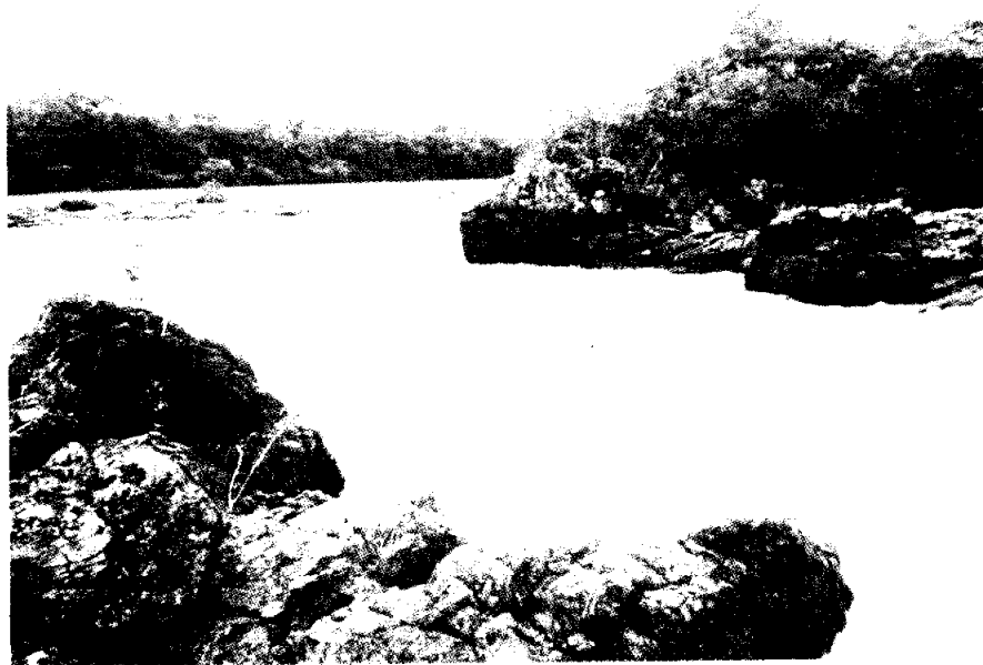
No.6 - Raudal del Tunia - Macayá.