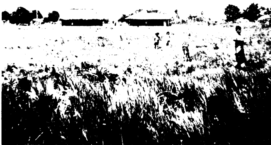
No.2 - Colonización - resguardo de Yaguará 2a.