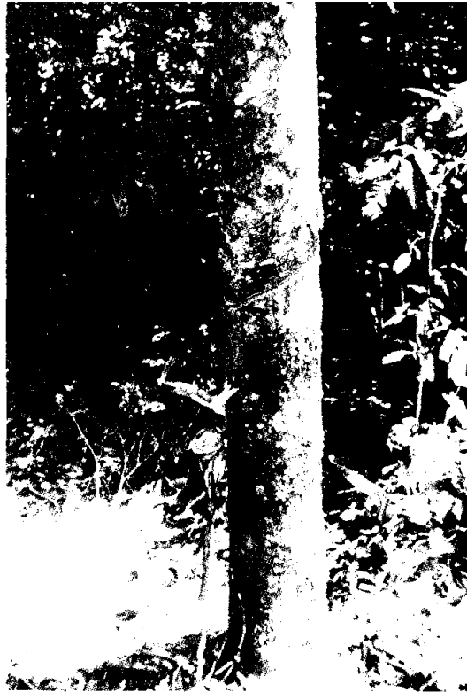
No.7 - Extracción del látex de la hevea. Note el corte y la tiyela.