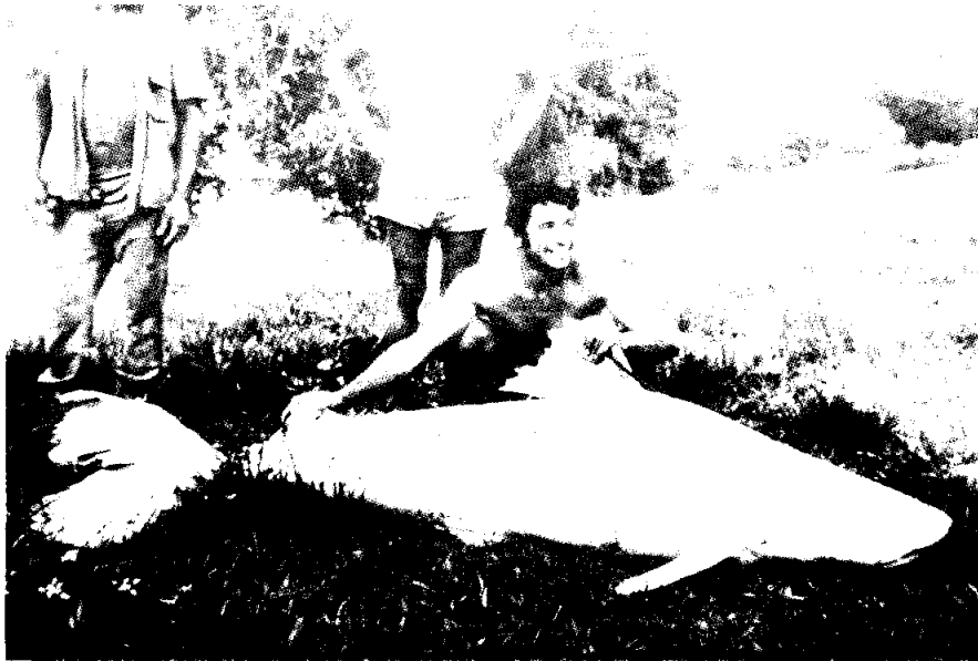
No.8 - Lechero o valentón ( Brachyplatystoma sp.) de tamaño mediano.